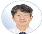
Lim Seung-kwan Commissioner KDCA