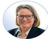
An Vermeersch CPVMO GAVI