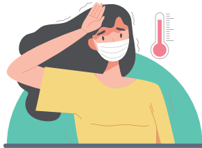
발열, 메스꺼움, 근육통