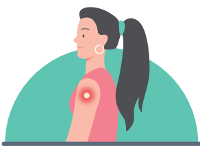
접종부위 통증, 부기, 발적

예방접종 후에 아래와 같은 증상이 흔하게 발생할 수 있으며, 이는 면역이 형성되는 과정에서 나타날 수 있는 반응으로 대부분 2~3일 이내에 사라집니다.