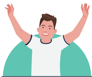
건강상태 좋을 때 접종