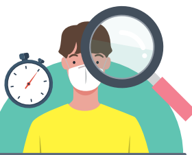
접종기관에서 이상 반응 관찰